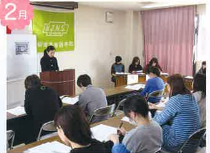
ケーススタディ発表会