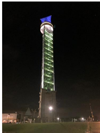
【クロスランドタワー】