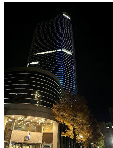
【インテックタワー111】